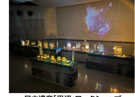
日本遺産「里沼」ワークショップ ヨシ工作体験「ヨシ灯りをつくろう！」(令和7年12月)