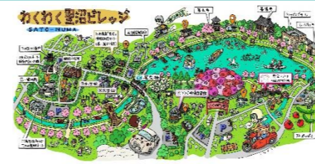
守りの沼・城沼エリア マップ改訂(令和8年3月)