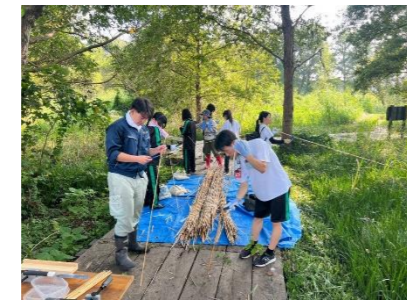
館林商工高等学校 里沼活性化班 「里沼」フィールドワーク(令和7年9月)