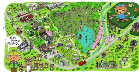
祈りの沼・茂林寺沼エリア マップ改訂(令和8年3月)