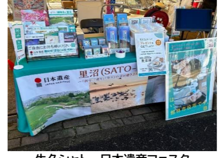
牛久シャトー日本遺産フェスタ (令和8年3月)