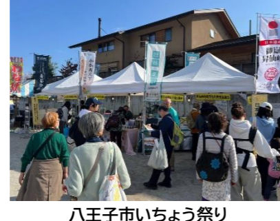
八王子市いちよう祭り 「里沼」PRブース出展(令和7年11月)