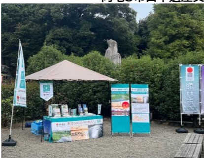
「里沼」PRブース出展・向井千秋記念子ども科学館「里沼」コース 釋奠体験