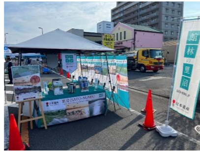
日本遺産「里沼」PRブース設置 館林七夕まつり 館林青年会議所×里沼(令和7年8月)