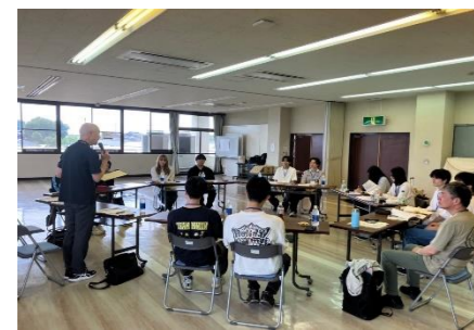
日本遺産「里沼」サステナブルツアー 武蔵野大学サステナビリティ学科(令和7年6月)