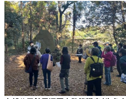
中部公民館里沼歴史散策講座(牛久市) (令和7年11月)