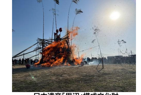
日本遺産「里沼」構成文化財 「堀工町どんと焼き(令和8年1月)

日本遺産「里沼」は認定から6年の節目を越え、7月31日に文化庁より認定継続が決定いたしました。これまでに積み重ねてきた活動が評価された結果であり、「里沼」が地域の誇りとしてより一層深く市民の皆様の生活に定着している証と言えます。市内小中学生を対象に実施した里沼認知度調査では、昨年を上回る92.48% (前年比+0.32%)を記録し、過去最高を更新しております。この一年は、次代を担う学生を主役とした事業を重点的に展開いたしました。市内小中学校等での出前講座を積極的に行い、各分野のプレーヤーとともにワークショップを多数開催いたしました。「里沼」を肌で感じ、自ら体験することで、その魅力を深く理解してもらうための取り組みを強化しております。また、周遊促進に向けた取り組みとして、昨年制作した「里沼」イラストマップを刷新いたしました。各沼エリアの個性を表現した新しいデザインは、市内外の皆様へ「里沼」の魅力伝えるためのツールとして活用してまいります。さらに、外部との連携として昨年同様にアートワークーションを実施。新たにアーティストを5名加え、計7名のアーティストを「里沼」に招き、滞在制作を行いました。アーティストならではの視点で「里沼」を捉え、独自の感性で表現していただくことで、地域資源の新たな価値を広く発信いたしました。認定継続を新たなスタート地点とし、これからも「里沼」の魅力を深掘り、地域外へ向けても積極的に情報を発信してまいります。 【館林市「日本遺産」推進協議会(館林市教育部文化振興課日本遺産推進係)】