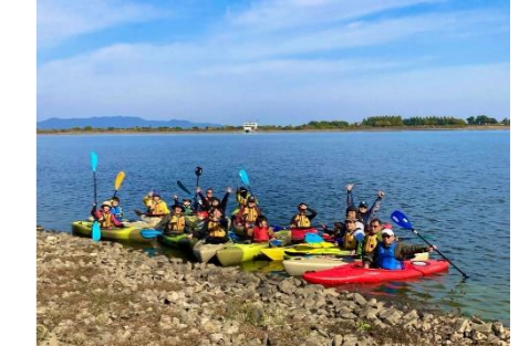
里沼カヌー・カヤック講座①～⑤ (令和7年6月～11月)