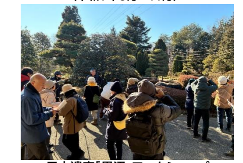
日本遺産「里沼」ワークショップ 多々良沼講座「里沼」バードウォッチング(令和8年1月)