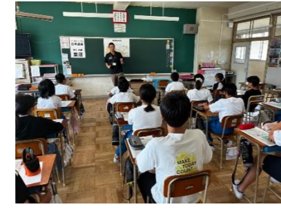
市内学校・公民館へへの出前講座(通年)