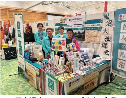
日本遺産フェスティバル in 倉敷 「里沼」PRブース出展(令和7年10月)