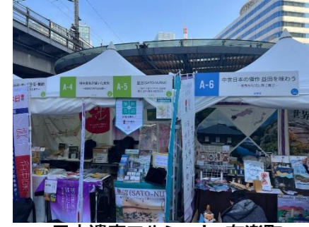
日本遺産マルシェ in 有楽町 「里沼」PRブース出展(令和8年2月)