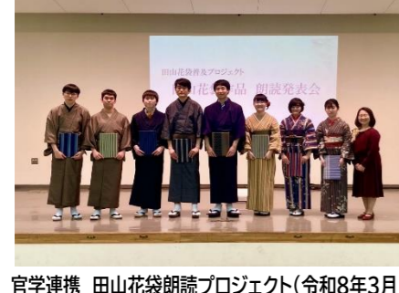
官学連携 田山花袋朗読プロジェクト(令和8年3月) (県立館林女子高等学校・県立館林高等学校・県立太田高等学校)