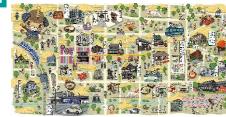
もてなし文化のエリア マップ改訂(令和8年3月)