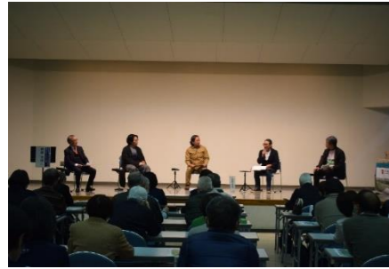
日本遺産「里沼」シンポジウム ～里沼をめぐる新たな取組みと未来を考える～(令和8年2月)