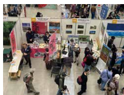
2023年八王子フェスの様子

展示ブースや体験ブースをめぐって全国の日本遺産に出会おう! ブースでは各地の日本遺産にちなんだ名産品などの販売も。