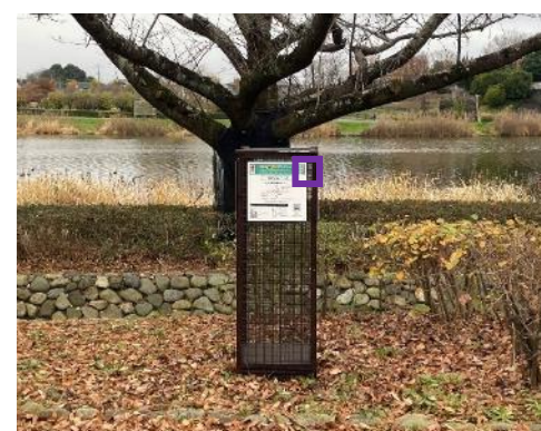
「AR里沼」の説明サイン